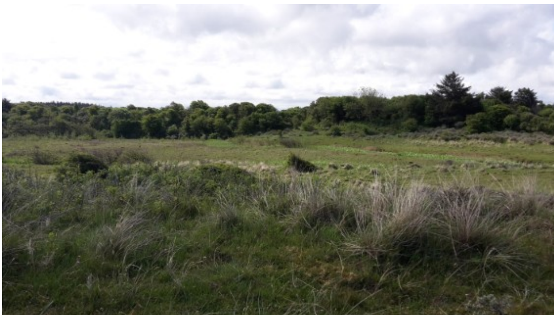
Tversted Klit.

Det første folkemøde om natur fandt sted 26.-28. maj i Hirtshals. Hjørring Kommune var initiativtager til mødet med debat om Danmarks natur for befolkning, politikere og organisationer. SEGES deltog aktivt i en række debatter som kort refereres herunder.