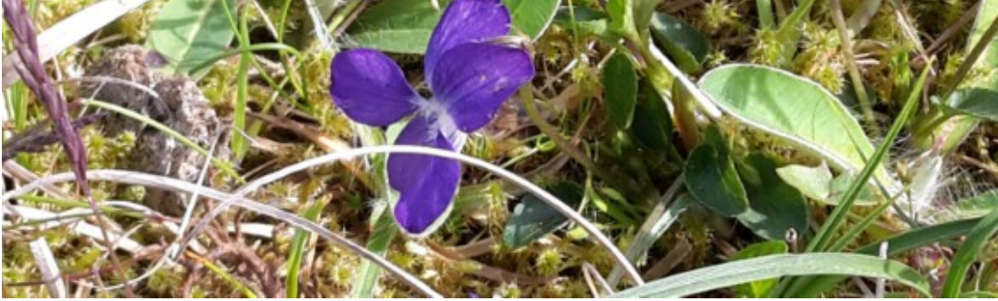
Hundevioli i Tversted Klit.